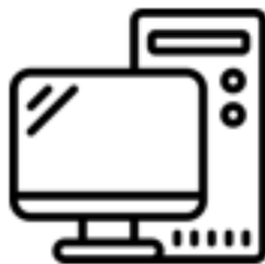
Počítač & Mobil