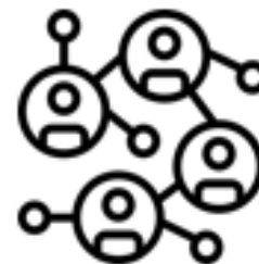
Internet & Sociálne siete