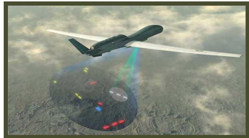
Global Hawk UAV