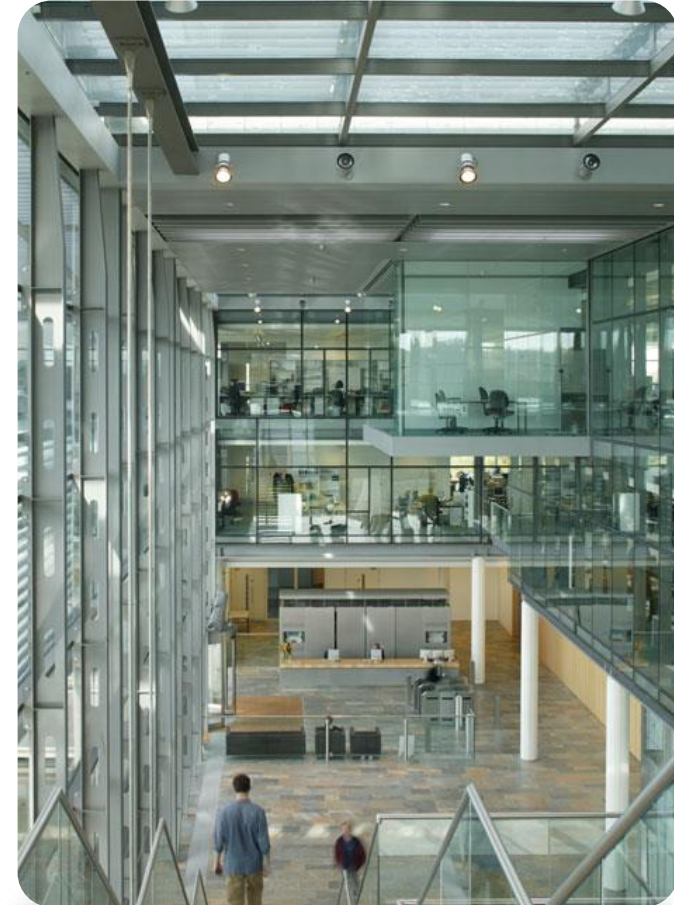
Sophos in Oxford, UK