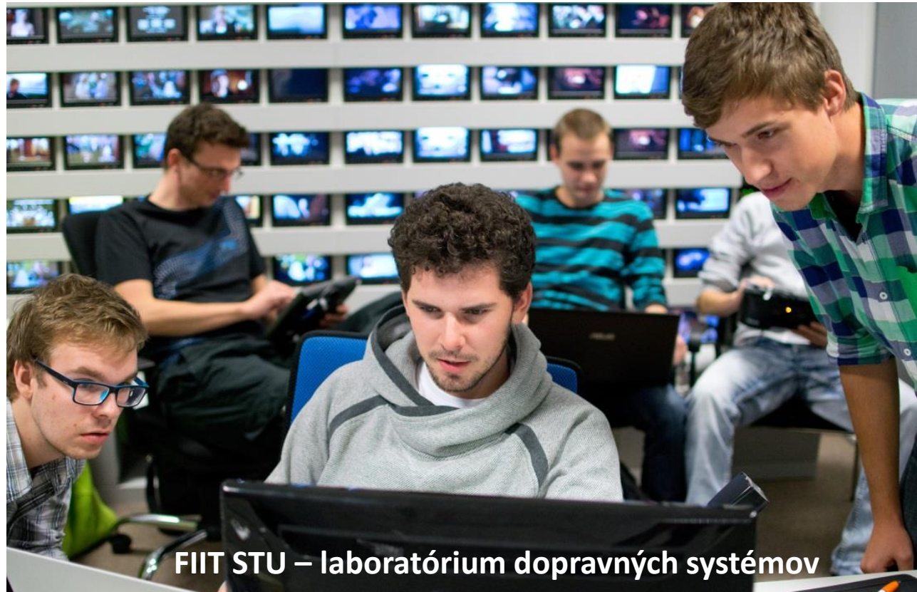
FIIT STU – laboratórium dopravných systémov