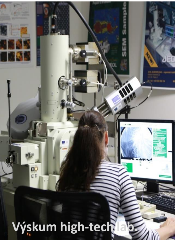
Výskum high-tech lab.